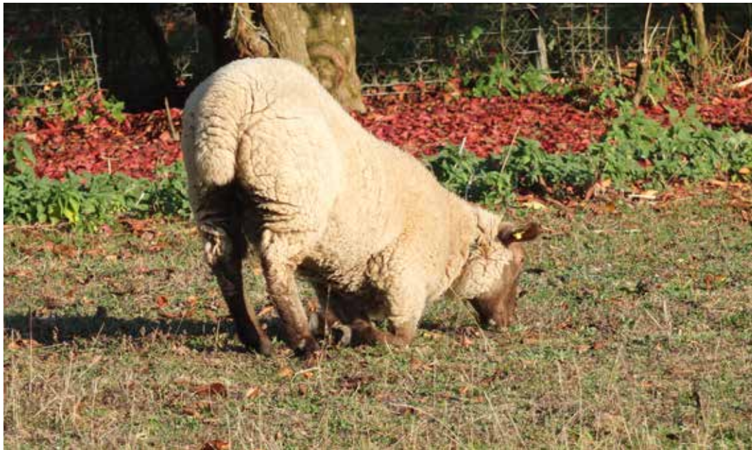
Pâturer sur les genoux: position typique d'un mouton souffrant du piétin.

Le piétin – également appelé pourriture des onglons, ou dermatite interdigitée contagieuse – est une affection contagieuse et douloureuse des onglons. Il touche les animaux de toutes races et tous âges confondus. Les troupeaux de moutons atteints par le piétin sont reconnaissables à la présence d'animaux (isolés ou en nombre) qui pâturent à genoux. À l'échelle mondiale, c'est une des maladies ovines aux plus fortes incidences économiques; la Nouvelle-Zélande, avec environ 40 mio. de moutons, estime les frais directs entre 60 et 80 mio. de francs par an. Cela découle principalement d'un manque à gagner: moins bonnes performances d'allaitement ou d'engraissement, diminution de la fécondité, réformes prématurées, recettes plus faibles, à quoi s'ajoutent les frais de traitement. Des études récentes menées en Suisse montrent que les agneaux infectés ont besoin d'environ 30 jours de plus que les agneaux en bonne santé pour atteindre le poids d'abattage et qu'avec les frais de traitement, les pertes en Suisse se montent chaque année à près de 6.6 millions CHF, pour un cheptel ovin d'environ 400 000 animaux.