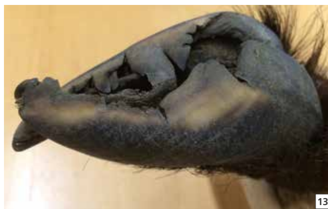
13 Lésions dues au piétin sur les onglons d'un bouquetin.