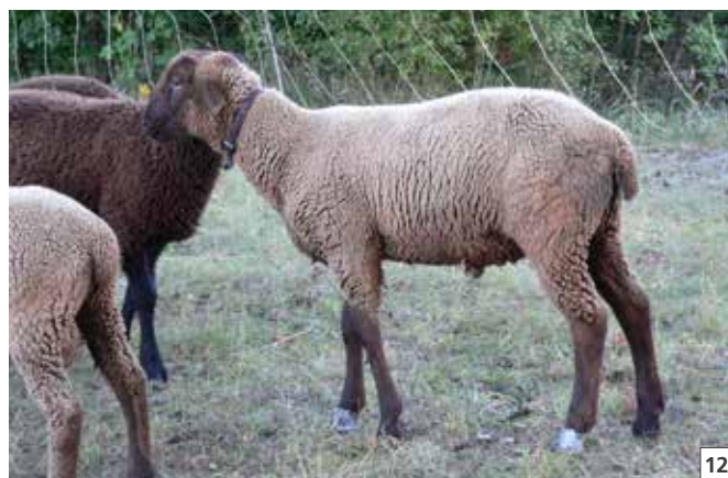
12 Pansement d'onglon: uniquement dans des cas exceptionnels.

Il n'y a pas de piétin en l'absence de la bactérie Dichelobacter nodosus dans un troupeau. Le germe est tributaire des onglons pour se multiplier et ne peut pas survivre plus de quatre semaines sur les pâturages.