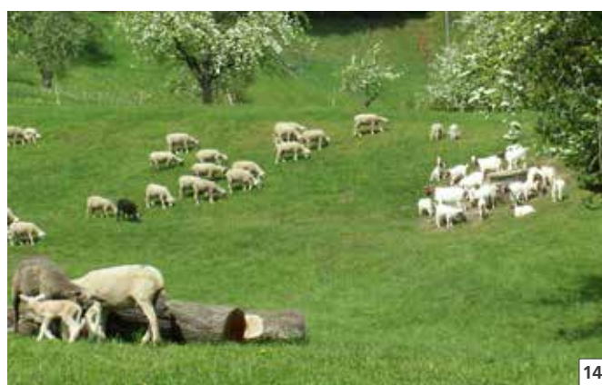
14 Lors de garde commune, il faut également traiter les chèvres.